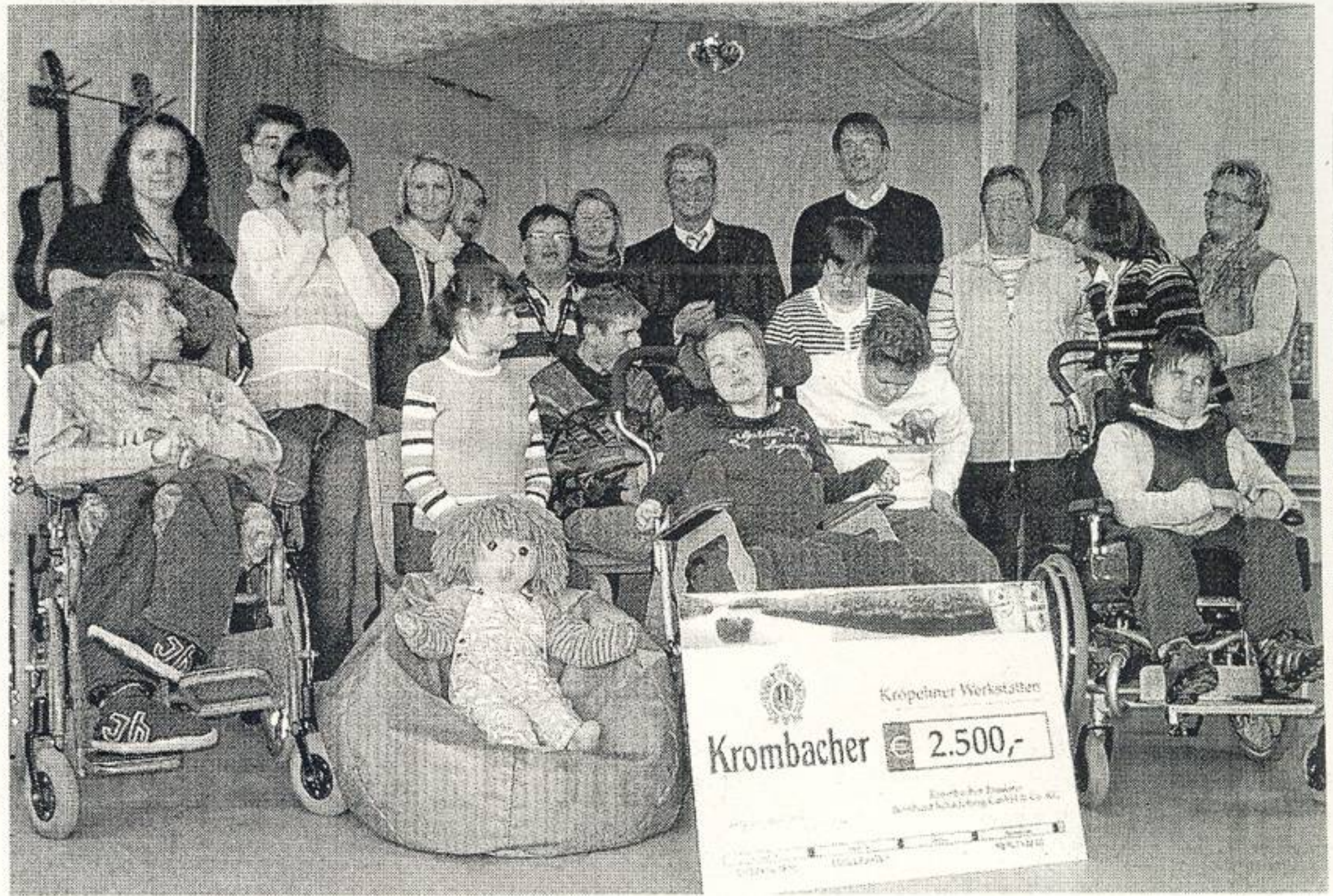
Die Freude war groß, als der Scheck überreicht und dann noch ein Foto gemacht wurde.