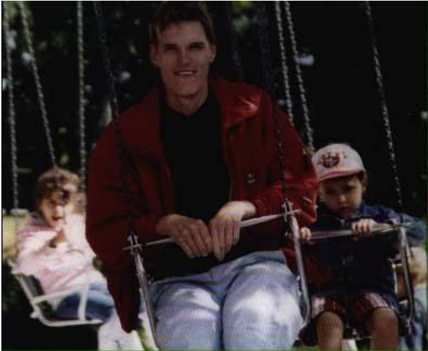
Der FED hält ein breites Angebot für die Freizeitgestaltung bereit.

Die Familien tragen die Hauptverantwortung bei der Erziehung, Betreuung und Pflege von Angehörigen mit Behinderung. Die Familien erhalten dabei Unterstützung durch eine Vielzahl von teilstationären Hilfen und Angeboten. Dennoch gibt es Betreuungslücken, z.B. am Nachmittag, abends, an Wochenenden und in den Schulferien. Diese Betreuungslücken sind für die betroffenen Familien problematisch. Der FED will dazu beitragen, diese Lücken zu füllen, indem er individuelle Hilfsangebote zur Entlastung der Familien vorhält.