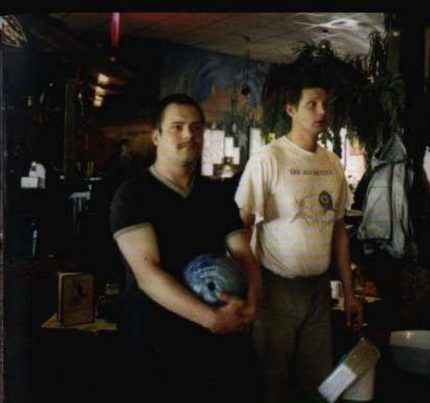
Sportliche Aktivitäten sind bei den Betreuten beliebt.