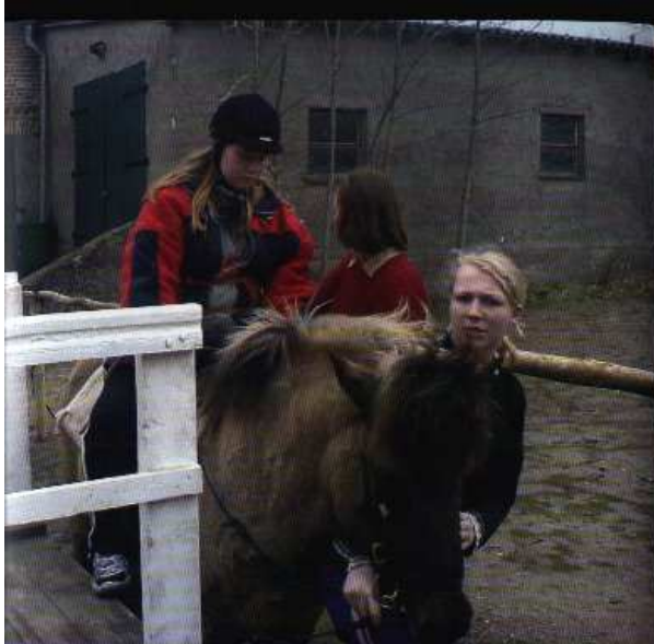
Der Umgang mit den Pferden bietet den Menschen mit Behinderung Entspannung und Freude.