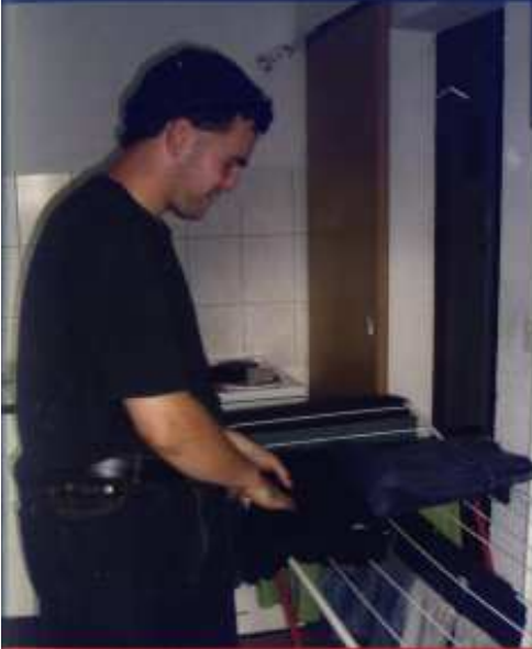
Programm des TW und ABW gehören hauswirtschaftliche Aufgaben

Das Trainingswohnen ist eine Zwischenstufe zwischen dem Leben in der Familie bzw. im Wohnheim und dem Ambulant Betreuten Wohnen.