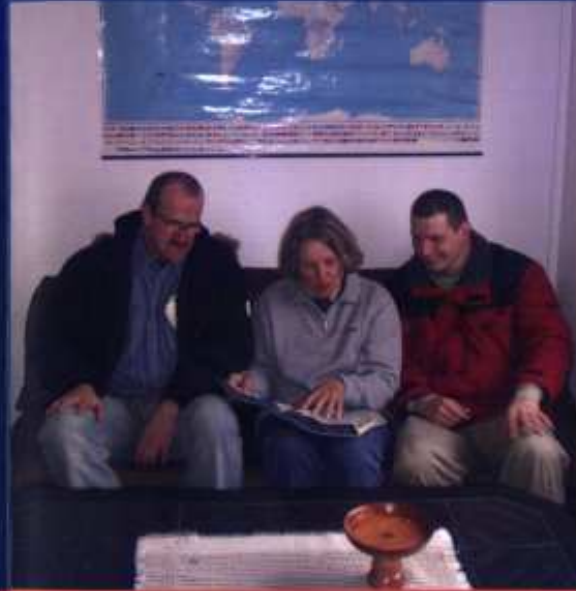
Gemeinsam planen Betreute und Mitarbeiter des ABW die Freizeitbeschäftigungen

Das Ambulant Betreute Wohnen ist ein Angebot für Menschen mit Behinderung, die in einer eigenen Wohnung leben möchten und können.