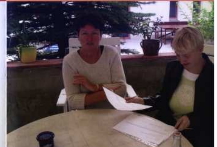
Oft wird Hilfe beim Ausfüllen von Formularen benötigt