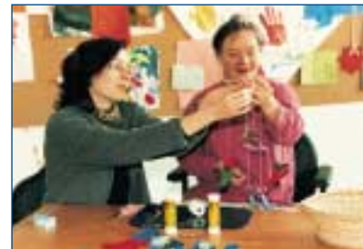
Betreuung in der Fördergruppe an der WfbM.

Leistungen: Wäscherei, Holzverarbeitung, Montage- und Verpackungsarbeiten, Stempel- und Schilderfertigung, Keramik, Landschaftspflege, Kochen und Backen