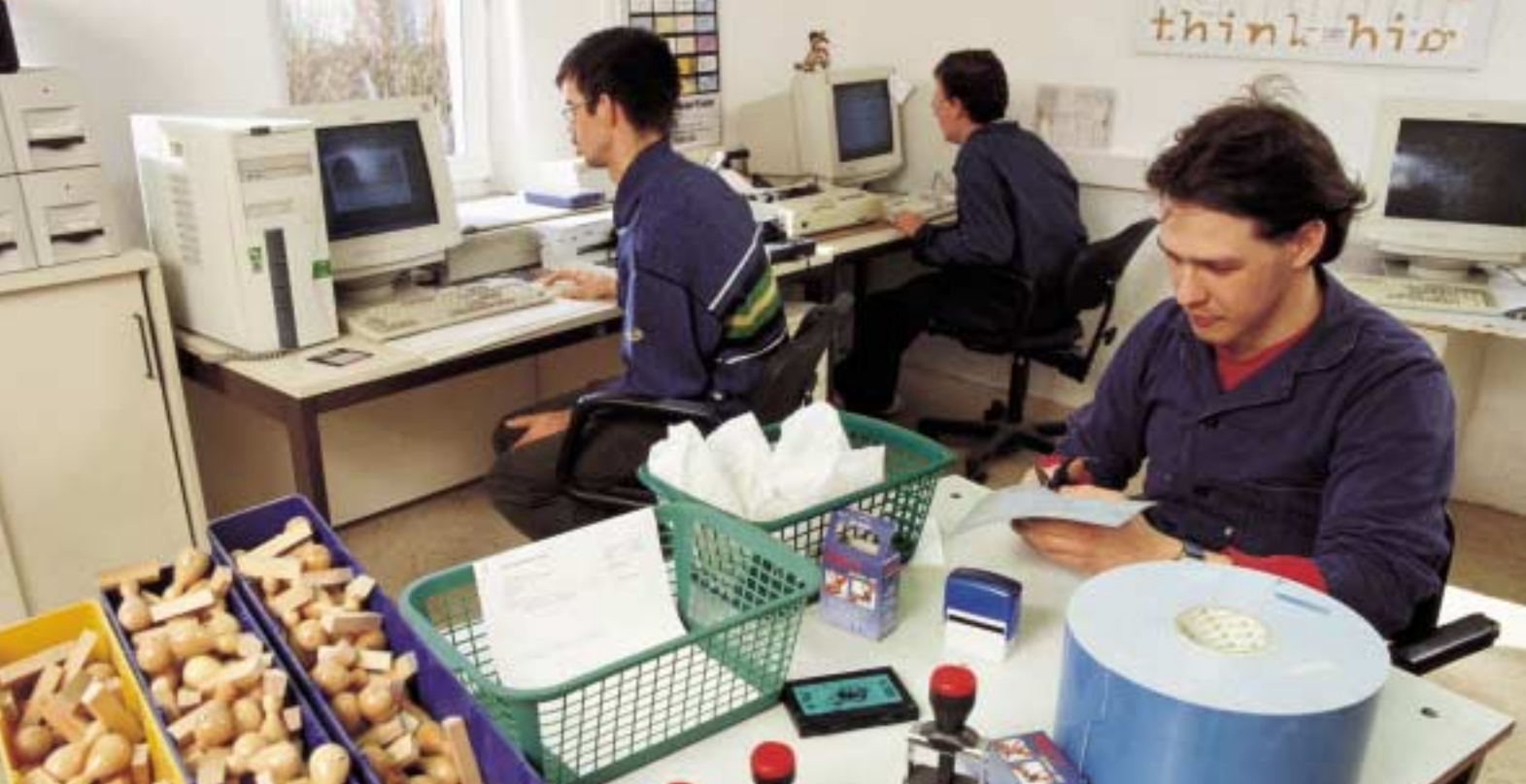
Hand- und Computerarbeitsplätze in der Stempelfertigung.

Die Werkstatt für behinderte Menschen (WfbM) im Michaelshof steht allen jugendlichen und erwachsenen Menschen mit Behinderung aus Rostock und dem östlichen Teil des Landkreises Bad Doberan offen, die nicht oder noch nicht auf dem allgemeinen Arbeitsmarkt arbeiten können. Nach dem Durchlaufen des Berufsbildungsbereiches erfolgt eine Beschäftigung in einem der Arbeitsbereiche der WfbM. Für die Menschen mit Behinderung, die keiner Beschäftigung in der Werkstatt nachgehen können, erfolgt die Betreuung in der Fördergruppe an der WfbM.