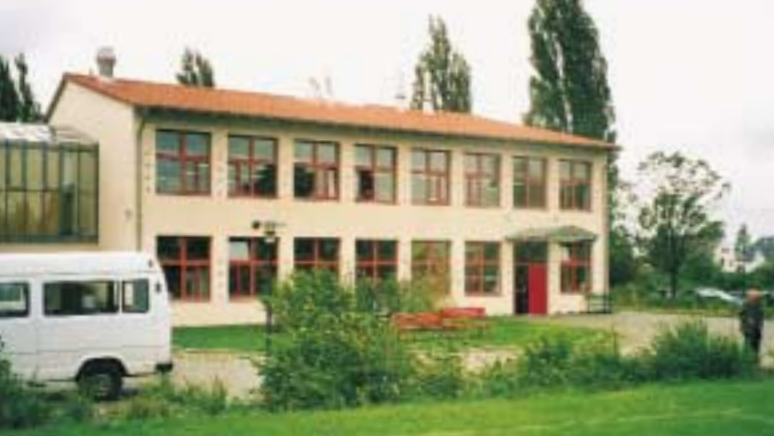
Das neue Gebäude der WfbM wurde 1996 erbaut.

Menschen mit Behinderung einen Arbeitsplatz anzubieten, der sie ausfüllt, sie fordert und fördert - so lässt sich der Integrationsauftrag in der WfbM umreißen. Dies ist mit der Absicht der Teilhabe behinderter Menschen am Arbeitsleben verbunden. In verschiedenen Arbeitsbereichen erfüllen die Beschäftigten gewissenhaft und qualitätsgerecht die ihnen übertragenen Arbeitsaufträge.