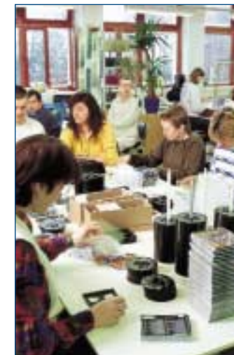
links: In mehreren Arbeitsgängen werden CD's verpackt. unten: Die Landschaftspflege erfolgt unter Einsatz moderner Technik.