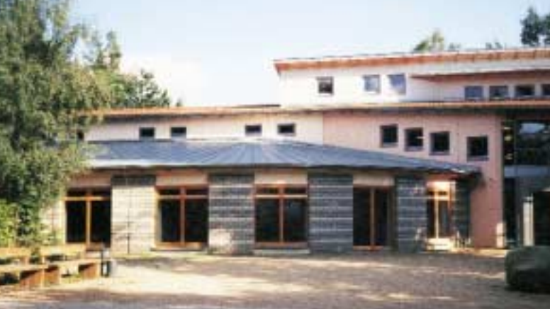
Die St. Michael-Schule mit großzügigem Schulhof und Spielgeräten.

Die St. Michael-Schule ist eine staatlich anerkannte Förderschule zur individuellen Lebensbewältigung. Sie steht den schulpflichtigen Kindern des Michaelshofes sowie anderen geistig und mehrfach behinderten Kindern aus Rostock und Umgebung offen. Das 1996 eingeweihte Gebäude entspricht den neuesten Erkenntnissen der Behindertenhilfe. In neun Klassen lernen die Schüler vor allem Selbständigkeit in allen Bereichen des täglichen Lebens. Außer Sonderpädagogen sind auch Logopäden, Physiotherapeuten, Musiktherapeuten und Ergotherapeuten in die schulische Ausbildung einbezogen. In der St. Michael-Schule können Zivildienstleistende eingesetzt werden. Die Schule ist auch Ausbildungsort für Sonderpädagogen.