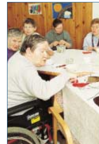
links: Mit Frohsinn und Geschick basteln die Bewohner kleine Geschenke. unten: Pflegeaufgaben werden durch moderne Technik erleichtert.