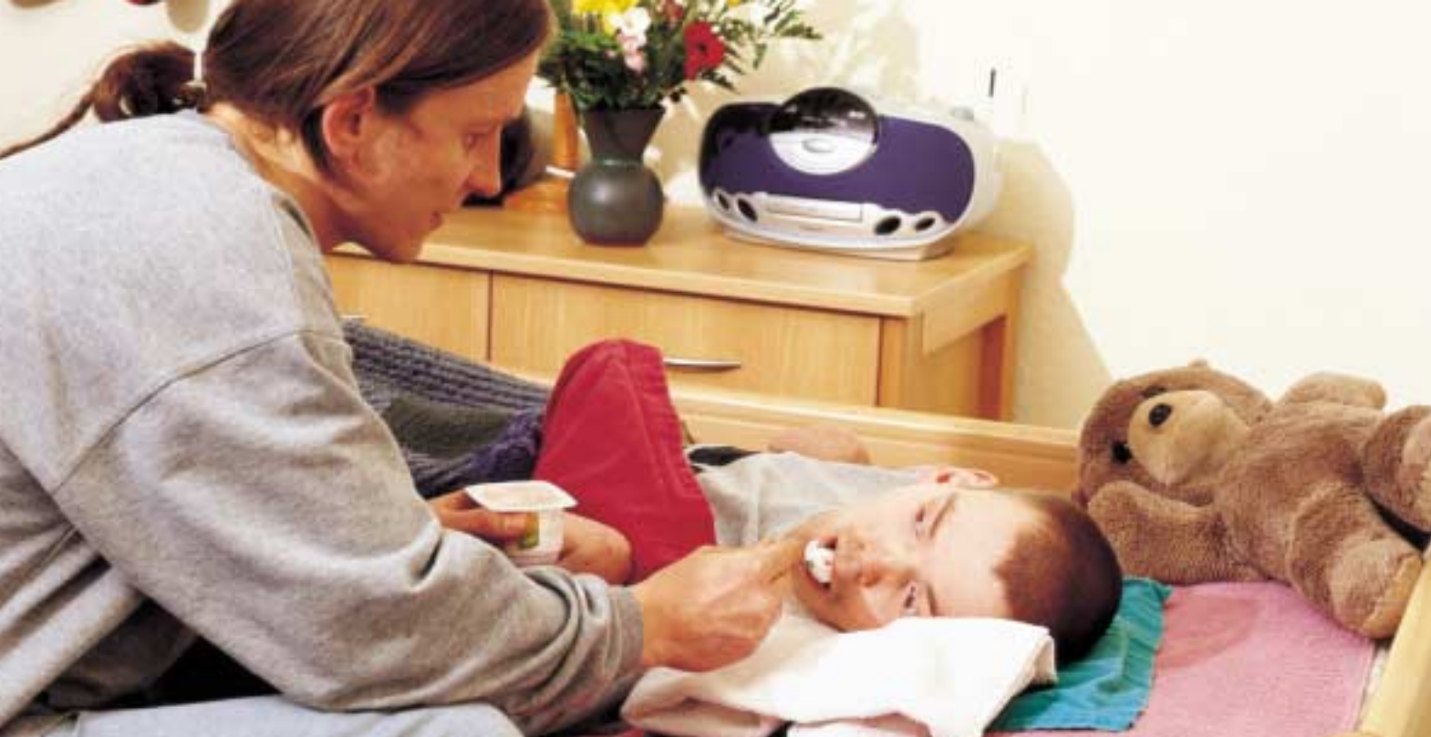
Für ein freundliches Wort ist immer Zeit, auch beim Reichen einer Mahlzeit.