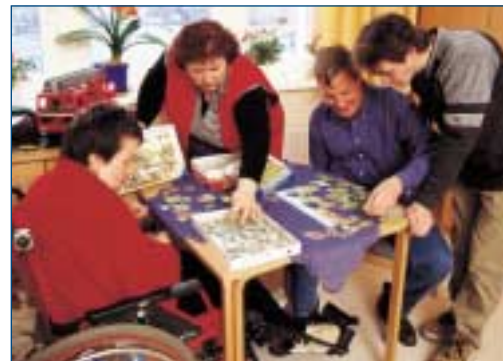
Bewohner und Mitarbeiter beim gemeinsamen Spiel am Wochenende.

Ausstattung: überwiegend komfortable 2-Bett-Zimmer sowie Einzelzimmer