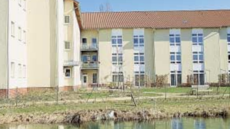
Das Krabbehaus wurde 1996 erbaut.

Im Wohnheim wie auch im Pflegeheim ist eine möglichst hohe Lebensqualität für die Menschen mit Behinderung das Ziel von aktivierender Pflege, Betreuung, Beratung und Förderung. Dabei orientieren sich alle Angebote an den individuellen Fähigkeiten und Bedürfnissen jedes Einzelnen.