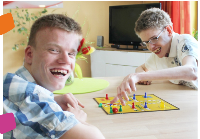
Mit Ihrer Spende helfen Sie, Kindern mit geistiger oder mehrfacher Behinderung besondere Momente zu schenken.

Insbesondere für unsere Kinder in der Pflegewohngruppe ist es schwierig, in den Urlaub zu fahren. Wir sind auf Spenden Dritter angewiesen, weil von unseren Mitarbeitern begleitete Ferienfahrten Pflegebedürftiger nicht durch Kostenträger finanziert werden. Ein Feriensommer ist lang - insbesondere ein so schöner wie in diesem Jahr. Mit Ihrer Unterstützung hoffen wir darauf, dass unsere Kinder im nächsten Jahr wieder auf Reisen gehen und schöne Stunden erleben.