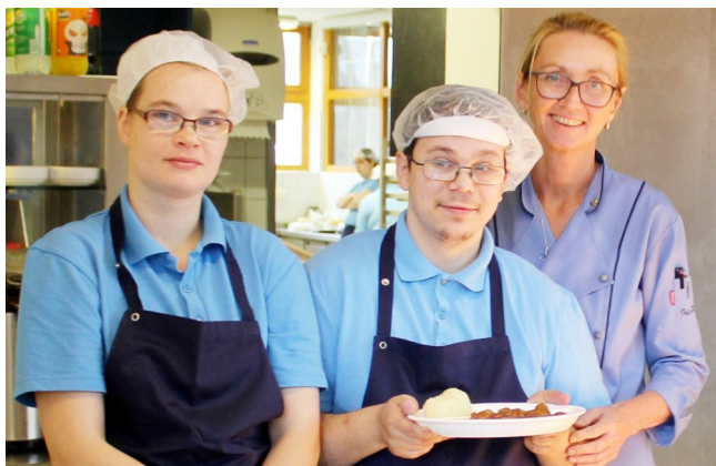
Das Küchenteam im Michaelwerk Kröpelin freut sich nach einem Umbau über moderne Küchentechnik und die große Speisenausgabe.

mitten unter uns hat der längste Frieden in Mitteleuropa anno 2018 seinen 73. Geburtstag gefeiert – doch der Weckruf der Jahreslosung 2019 ist wichtiger denn je: Suche Frieden! Kürzer kann eine Aufforderung kaum sein. Oder ist es eher eine Einladung um unseretwillen? Frieden ist keine Selbstverständlichkeit. Gefährdungen des Friedens sind unübersehbar: soziale Spaltungen, widerstreitende Interessenlagen, Individualismen, Nationalismen, Machtmissbrauch, uneinheitliche Wertevorstellungen... All das lebt unter uns. Und der Frieden? Der lebt nur dort, wo Menschen sich um Verständnis füreinander bemühen, Brücken bauen, Toleranz üben und so dem Frieden nachjagen, ihn immer wieder suchen und finden. In den vergangenen Jahrzehnten hat es diese Menschen in Europa gegeben - die weitere Lebendigkeit des Friedens liegt in unseren Herzen und Händen: Suche Frieden und jage ihm nach! Eine an Aktualität kaum zu überbietende Botschaft, die auch zum nahenden Weihnachtsfest passt: „Friede auf Erden und den Menschen ein Wohlgefallen.“ Im Großen wie im Kleinen. In einer anderen Übersetzung heißt es „... bei den Menschen, die guten Willens sind.“