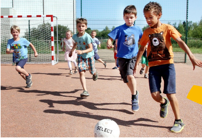
Das Wichtigste am gemeinsamen Spielen auf dem neuen Bolzplatz der Schule: Viel Bewegung und Spaß für alle!

Unsere Evangelische Inklusive Michaelschule wächst und gedeiht. Wir konnten mit einem zweiten großen Bauabschnitt am Dierkower Damm beginnen. Der fertiggestellte erste Abschnitt beherbergt derzeit mit viel gegenseitigem gutem Willen die Jahrgangsstufen 1-6.