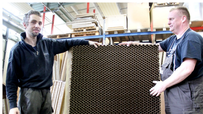
Außenarbeitsplätze sind ein guter Einstieg in ein reguläres Arbeitsverhältnis.

Im Michaelwerk begleiten und fördern wir mehr als 60 Menschen mit Behinderungen auf Außenarbeitsplätzen in diversen Unternehmen des Großraums Rostock. Die Herausforderung besteht darin, Arbeitsbedingungen so zu gestalten, dass unsere Beschäftigten ebenso zufrieden sind wie die Unternehmen, in denen sie tätig sind. Diesem Ziel stellen sich unsere Mitarbeiter im Michaelwerk jeden Tag.