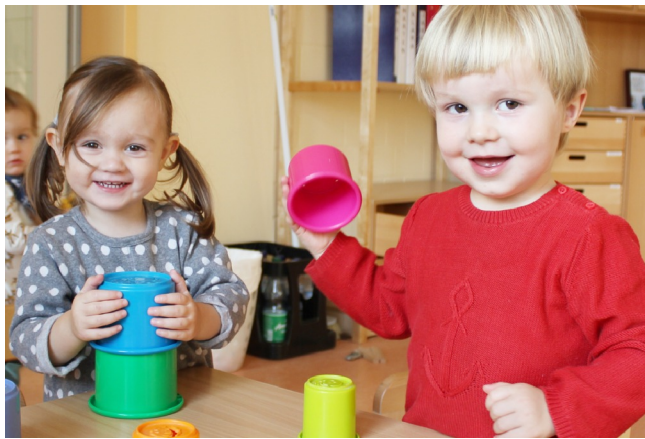
Zuwachs in der Kita: Aufgrund der großen Nachfrage wurde die Kita weiter ausgebaut. Derzeit gibt es 69 Betreuungsplätze.

Die Kita „Kleiner Michel“ eröffnete im März eine weitere Gruppe für Krippenkinder und wird im nächsten Jahr noch weiter ausgebaut werden. Die Michaelschule hat sich binnen fünf Jahren zu einem Geschäftsbereich mit über 500 Leistungsplätzen entwickelt. Darüber staunen wir selbst.